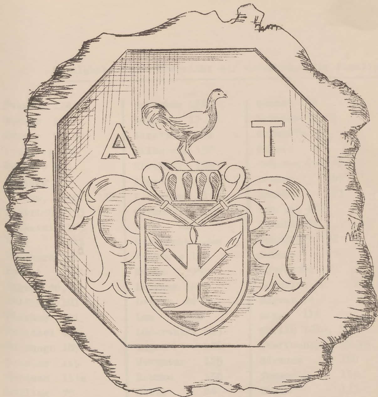
Siegel des Augustus Thilo Not. publ. in Sangerhausen 1661

Skizze 2 zeigt das Siegel von August (10), nach einem im Sangerhauser Stadtarchiv aufbewahrten Abdruck von 1661 in etwa 25facher Vergrößerung. Ein Brief seines Sohnes August (30), Original im Besitz des Bearbeiters, zeigt das gleiche Siegel. Wertvoller und jedenfalls heraldisch richtiger als das traditionelle Wappen ist dies alte Siegel, das gegebenenfalls die beste Grundlage für die Festlegung eines Wappens unseres Geschlechts bieten würde.