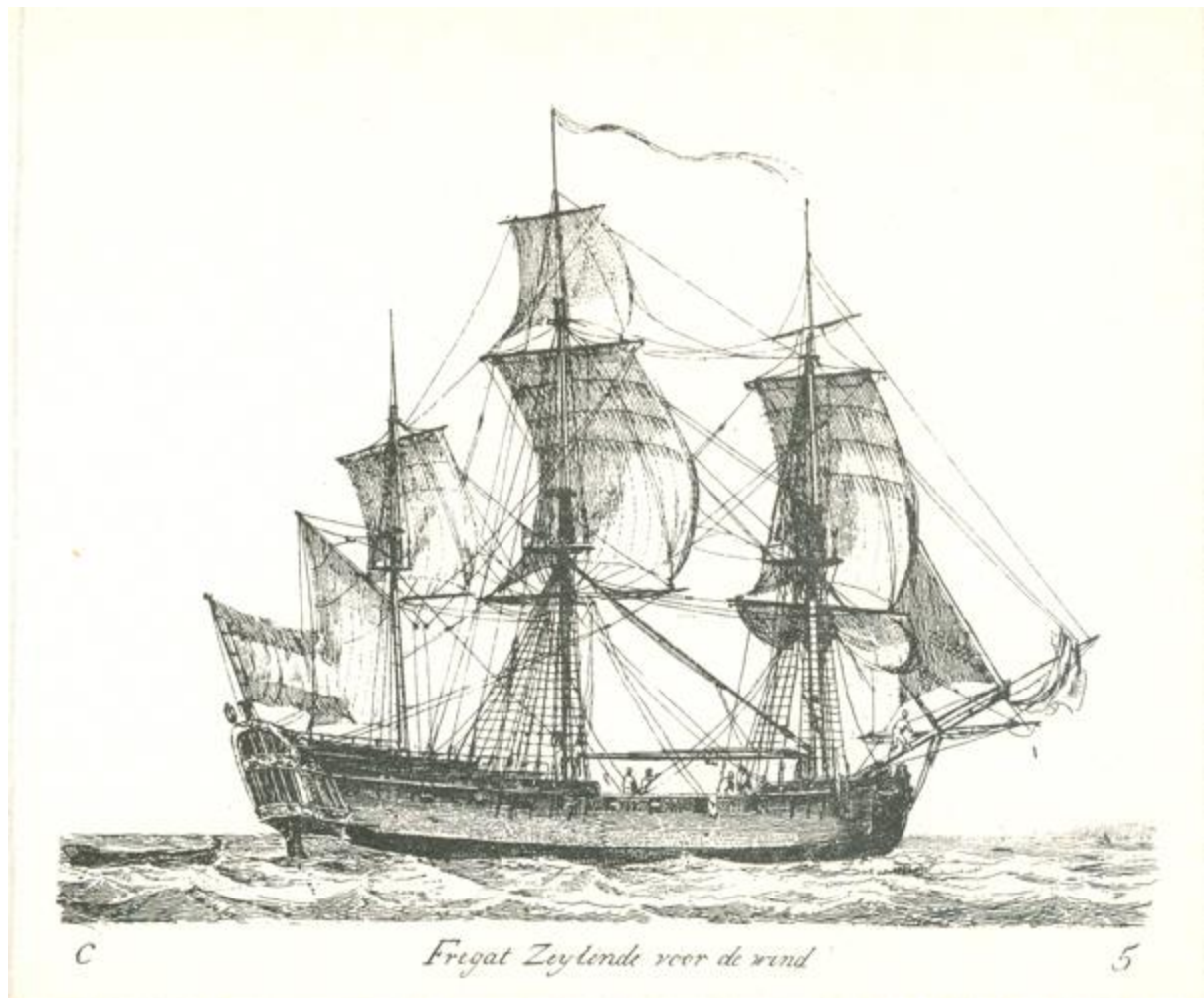
Fregatschip uit de achttiende eeuw. (Bron/ Gerrit Groenewegen, 1789, Rijksmuseum)